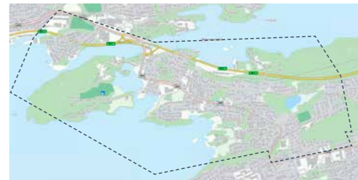
Gåseid, Ratvika, Nørvasund: 4. jun, 13. aug, 22. okt