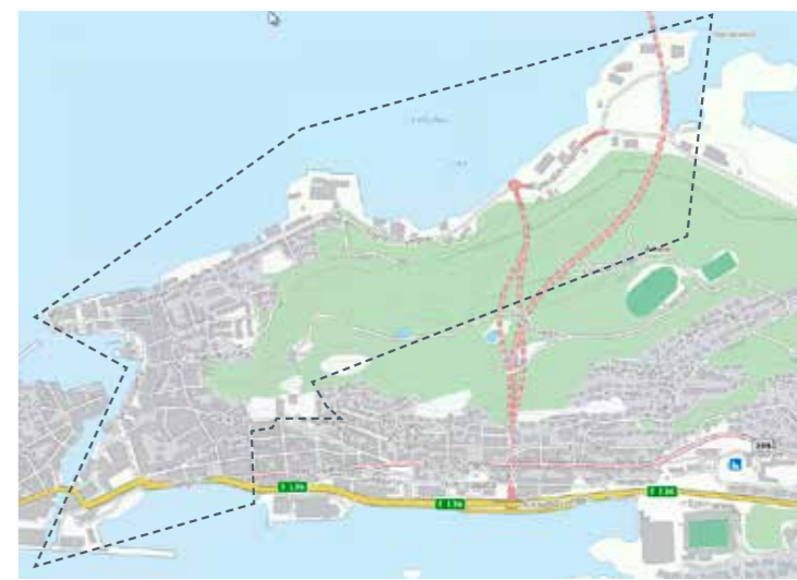
Sentrum aust med Flatholmen: 31. okt