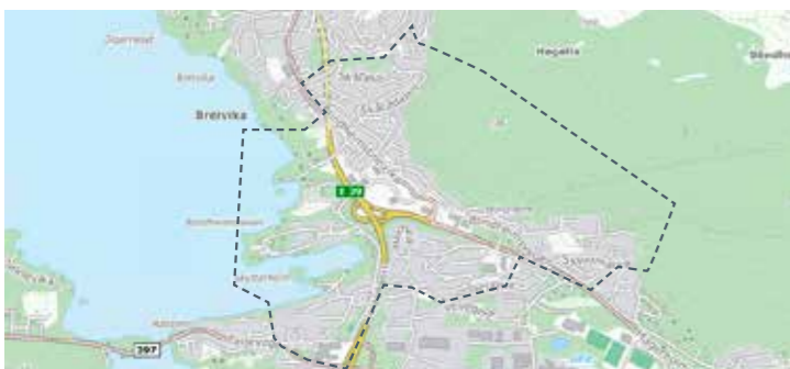
Blindheim, nedre Skothaugen, Blindheimsneset, Skyttarholmen 23. mai, 1. aug, 10. okt