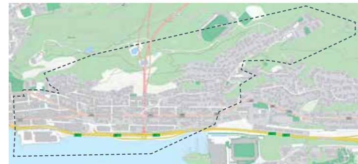
Frå Fjelltun mot sentrum til Røysegata og Grensegata: 30. okt