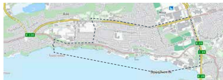
Frå Daekvartalet Moa til Sandingane, Åse til Geilebergvegen 29. mai, 8. aug, 17. okt