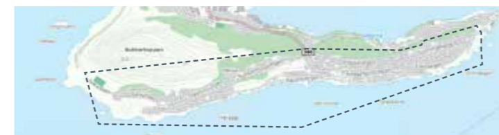
Hessa: 5. jun, 14. aug, 23. okt