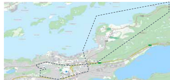
Alvika til rundkøyring Olsvika, Holssletta, Åsemulen, Breivikvegen 31. mai, 9. aug, 18. okt