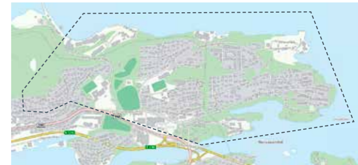
Larsgården til og med Bøgata i Fagerlia: 28. okt