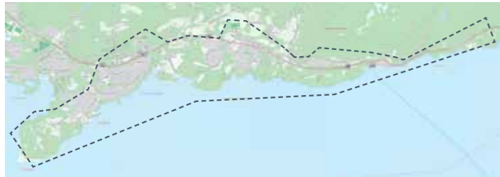
Frå Hesseberg til og med Flisnesvegen: 20. mai, 29. jul, 7. okt

Hugs å laste ned Min Renovasjon for å få varsel om tømming.