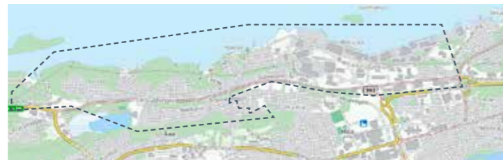
Breivika, frå rundkøyring Lerstad til rundkøyring Olsvika: 29. mai, 7. aug, 16. okt