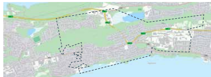
Frå Geilebergvegen/sjukehuset, Åsestranda, øvre Rørstadvegen, øvre Hatlane, Fureåsen, øvre Åsemarka, frå rundkøyring Lerstad til botnen av Lerstadbakken: 28. mai, 6. aug, 15. okt