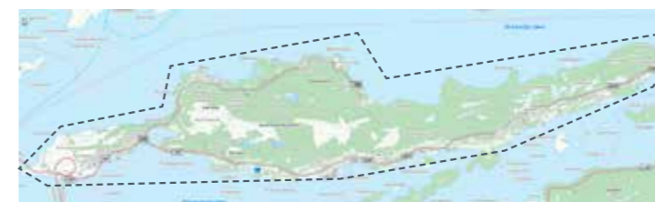
Ellingsøya: 7. jun, 16. aug, 25. okt