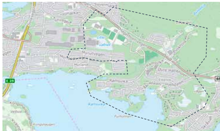
Olevågen, Ramsvika, Puskhola: 21. mai, 30. jul, 8. okt