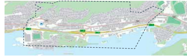
Kolvikbakken, Nørvegata, Volsdalen, Volsdalsbakken: 29. okt