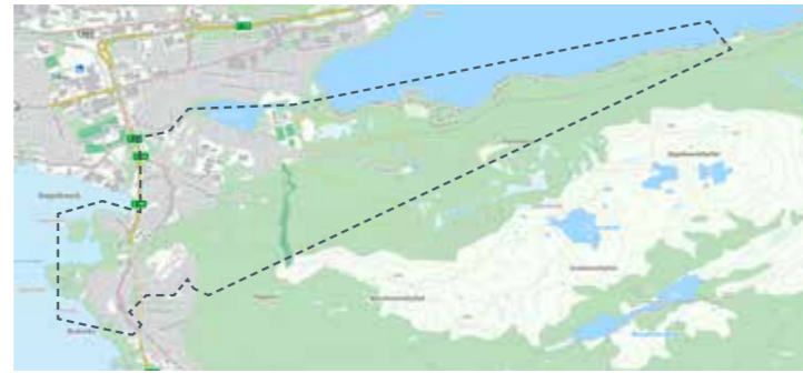
Øvre Skothaugen, Spjelkavika, Vasstranda: 24. mai, 2. aug, 11. okt