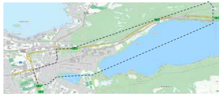
Frå Aspehaugen til Fremmerholen og Rødset: 27. mai, 5. aug, 14. okt