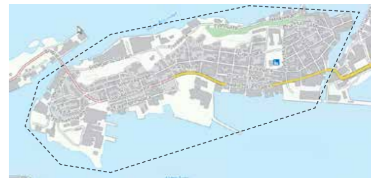
Aspøya: 1. nov