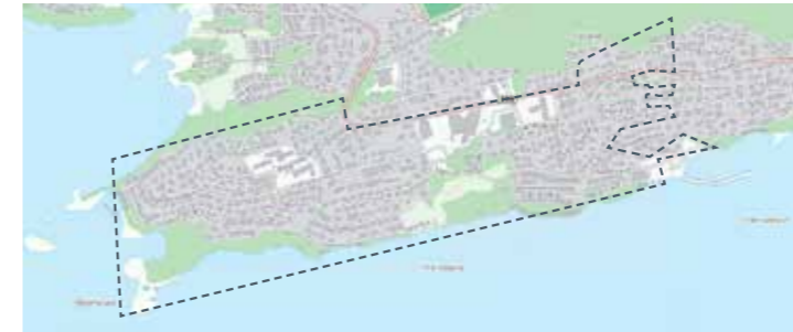
Hatlane frå Malaga, Bogneset: 3. jun, 12. aug, 21. okt