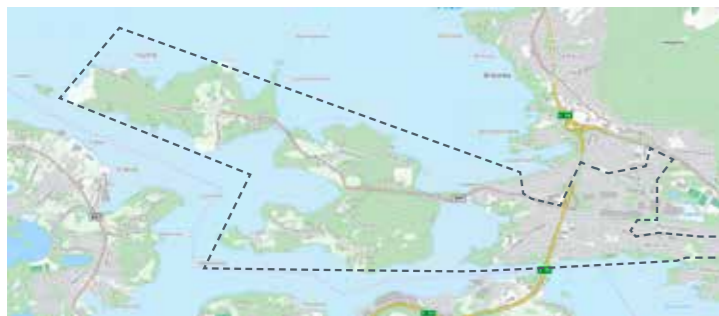
Vegsund, Myrland, Tørla, Humla: 22. mai, 31. jul, 9. okt