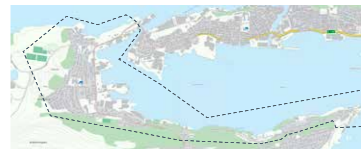
Slinningsodden, Skarbøvika til Steinvågbrua: 6. jun, 15. aug, 24. okt